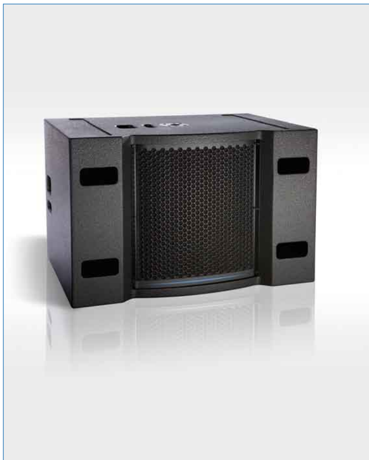
Enceinte d'infra basse TB118S

Le "subwoofer" TB118S est une enceinte de basses et d'infra basses alliant une ergonomie et performances acoustiques répondant à toutes les exigences des exploitants professionnels.